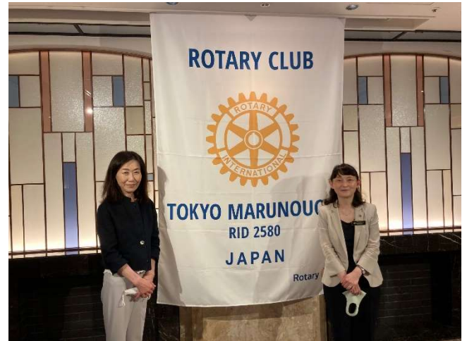
3 光行順子会員入会式